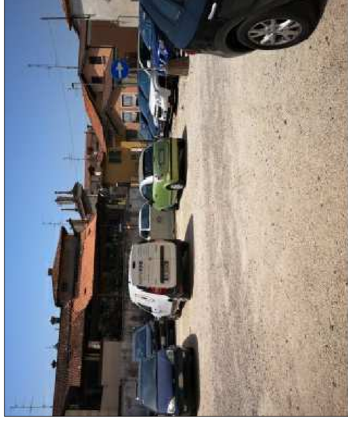
INTERNO PARCHEGGIO ATTUALE